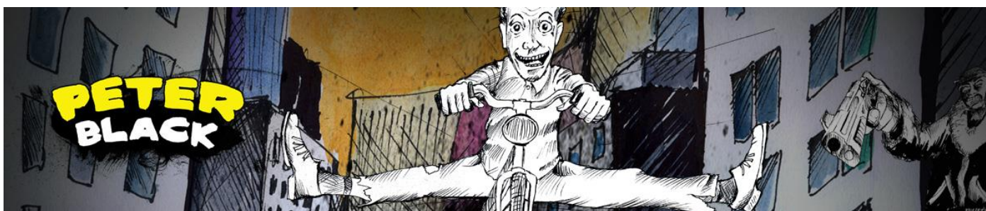
Peter Black (divadelnicentrum.cz)